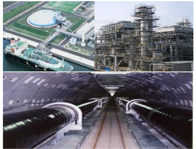
適用が想定される各種プラントエリア