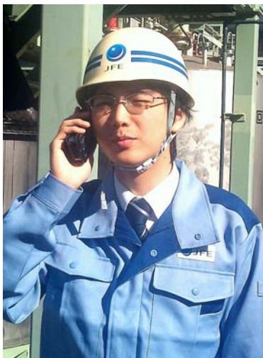
携帯電話本体による通話イメージ

注1: アクセスポイント(AP)との通信距離は、APの設置環境、及びAPIに接続している端末の台数により異なります。