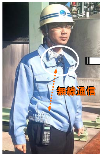
ハンズフリーによる通話イメージ