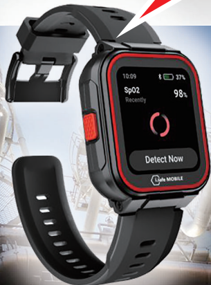
血中酸素飽和度(SpO 2 )モニター(*1)