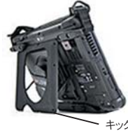
キック・スタンド