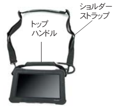
トップ・ハンドル&ショルダー・ストラップ 長時間携行の負担軽減