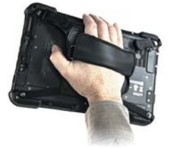
バック・ハンド・ストラップ 拡張バッテリーとの組み合わせも可能