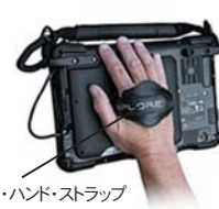
G2バック・ハンド・ストラップ